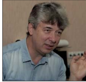
Вячеслав Захаренко доктор фіз.-мат наук, член-кор. НАН України, директор РІ НАН України, м. Харків

У 2024 році харківські астрономи відзначають 200-річчя заснування кафедри астрономії в Харківському університеті та 130 років з дня народження одного із засновників Харківської планетної школи Миколи Павловича Барабашова (1894–1971). НДІ астрономії та кафедра дбайливо зберігають наукові традиції харківської школи астрономії та астрофізики, продовжують працювати і виконувати науково-дослідні роботи та проекти в умовах воєнного стану.