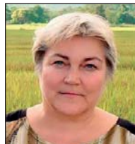
Ірина Вавилова доктор фіз.-мат наук, професор, член-кор. НАН України, зав. відділу ГАО НАН України, м. Київ

Довгострокова мета – надання науковим та освітнім установам доступу до кластера для консолідації наукової спільноти в комп'ютерних галузях та започаткуванню міждисциплінарних досліджень.