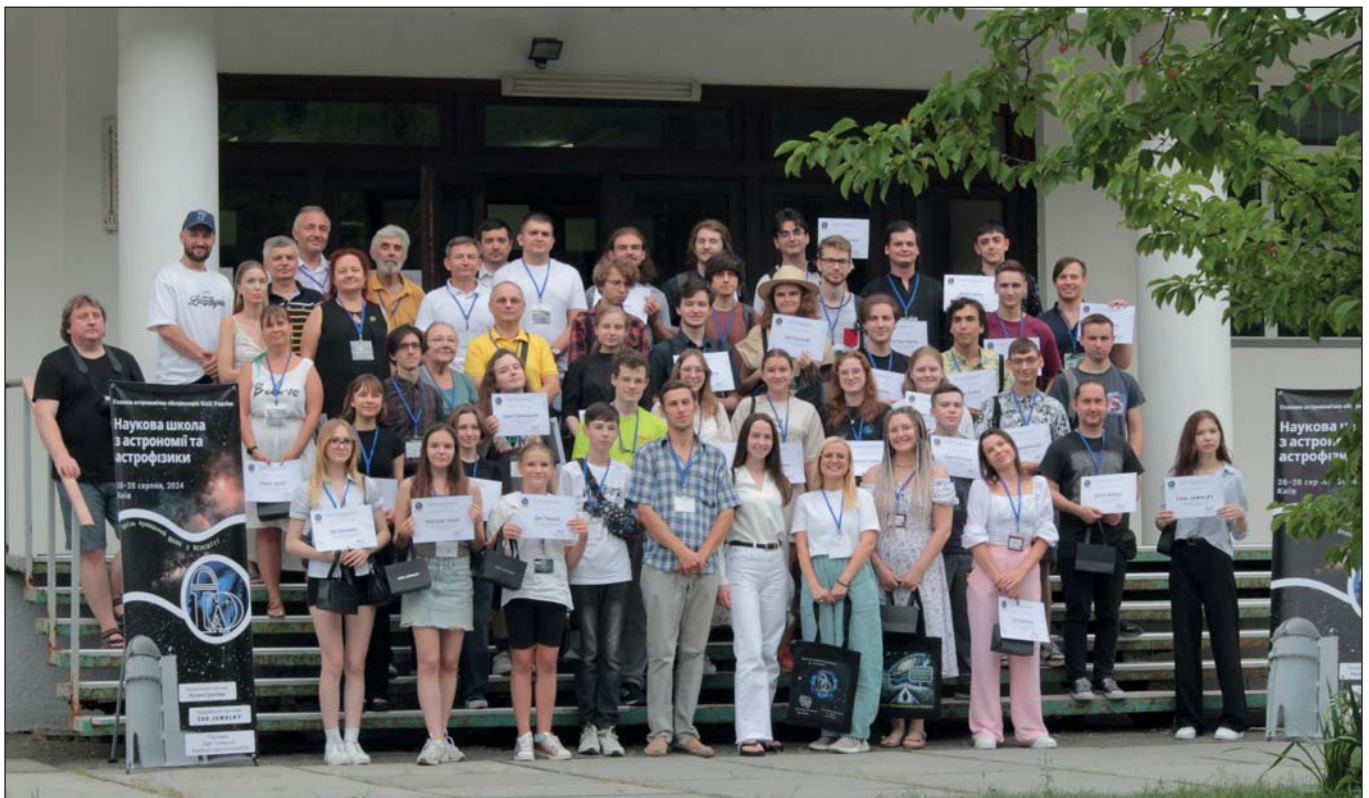
Учасники Наукової школи з астрономії та астрофізики ГАО НАН України. Київ, серпень 2024 р.