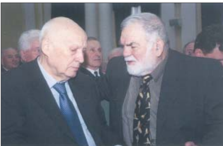
Володимир Платонов і перший віцепрезидент НАН України академік НАН України Володимир Горбулін