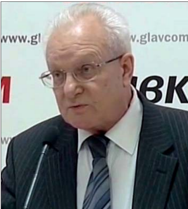
Володимир Василенко.

Гостра фаза достатньою мірою заслуговує назву «повномасштабна війна», і суть справи не в цьому. Російська агресія позначена назвою «спеціальна військова операція». Україна теж не оголошувала війну Росії. Проте за три роки повномасштабної війни ми починаємо розуміти, що ця війна спрямована Росією на ліквідацію української незалежності, спотворення національної ідентичності українців, заперечення їхнього права на існування, їхнє фізичне і ментальне винищення. Тільки тепер починаємо приходити до висновку, що російсько-українське протистояння в усі часи – дореволюційні, радянські і пострадянські – набувало прихований або відкритий вигляд війни. Екзистенційної війни!