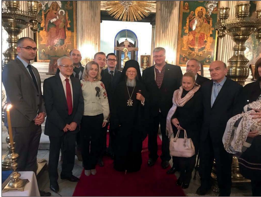
Володимир Василенко (другий зліва), Вселенський патріарх Варфоломій (в центрі), Андрій Сибіга (поряд з патріархом), Станіслав Кульчицький (другий праворуч) та інші після Патріаршої літургії на вшанування пам'яті жертв Голодомору. 2 грудня 2018 р. Фото з твіттеру Андрія Сибіги

Гостра фаза достатньою мірою заслуговує назву «повномасштабна війна», і суть справи не в цьому. Російська агресія позначена назвою «спеціальна військова операція». Україна теж не оголошувала війну Росії. Проте за три роки повномасштабної війни ми починаємо розуміти, що ця війна спрямована Росією на ліквідацію української незалежності, спотворення національної ідентичності українців, заперечення їхнього права на існування, їхнє фізичне і ментальне винищення. Тільки тепер починаємо приходити до висновку, що російсько-українське протистояння в усі часи – дореволюційні, радянські і пострадянські – набувало прихований або відкритий вигляд війни. Екзистенційної війни!