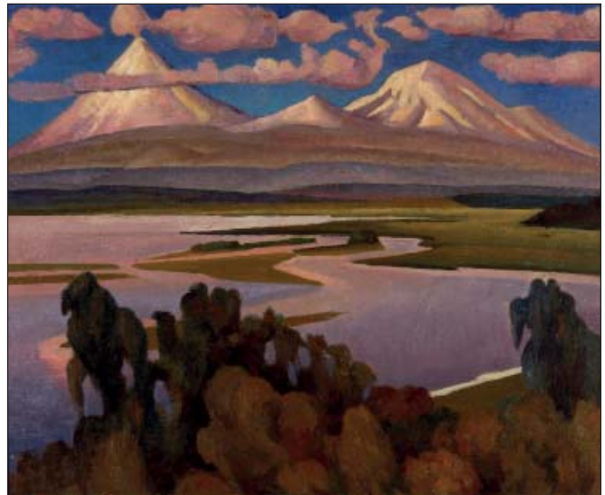
Ключівські вулкани восени