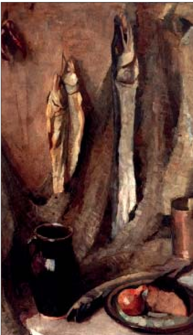
Натюрморт зі щуками