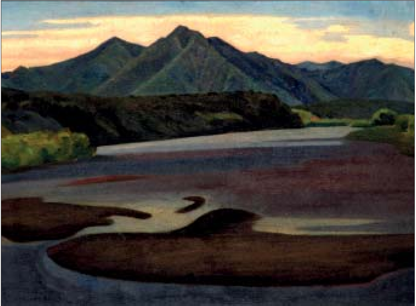
Затока Нижньокамчатська (тут будував свої кораблі Вігус Берінг)