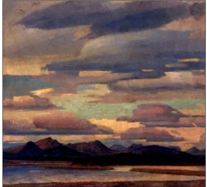
Звичайний день на Камчатці