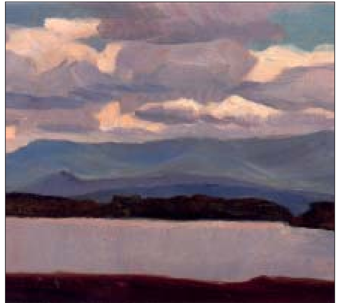
Острів Карагинський, річка Біла

був до вподоби великий творчий потенціал художника та поява на мистецькому небосхилі Волині такого майстра пензля. Але мистець не нарікав, він шкодує лише за тим, що упродовж цих двадцяти років від його далекосхідної епопеї потрібно було займатися не творчістю, а іншою роботою, зокрема і знайомою йому скульптурою та роботою в камені.