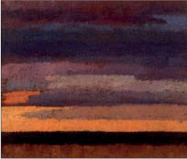
Захід сонця на березі Тихого океану