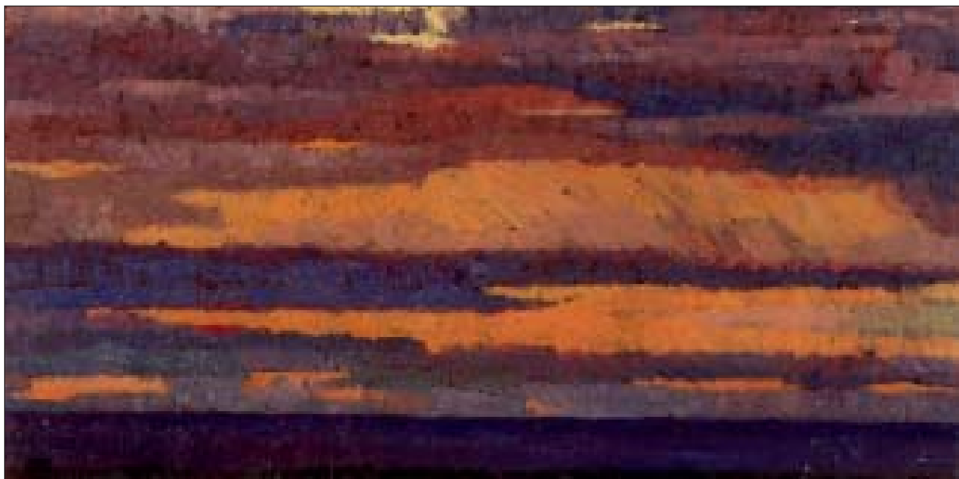
Захід сонця в прогоці Літке