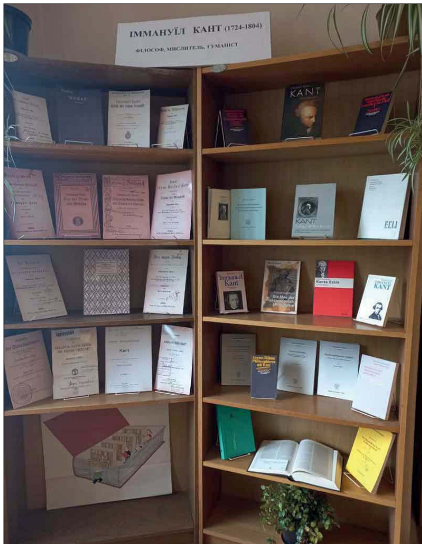
Сектор нової німецькомовної книги відділу європейської книги XIX–XX ст. ЛННБ України ім. В. Стефаніка розгорнув ювілейну виставку, присвячену основоположнику німецької класичної філософії Іммануїлу Канту, філософсько-естетична спадщина якого не втрачає свого значення і сьогодні