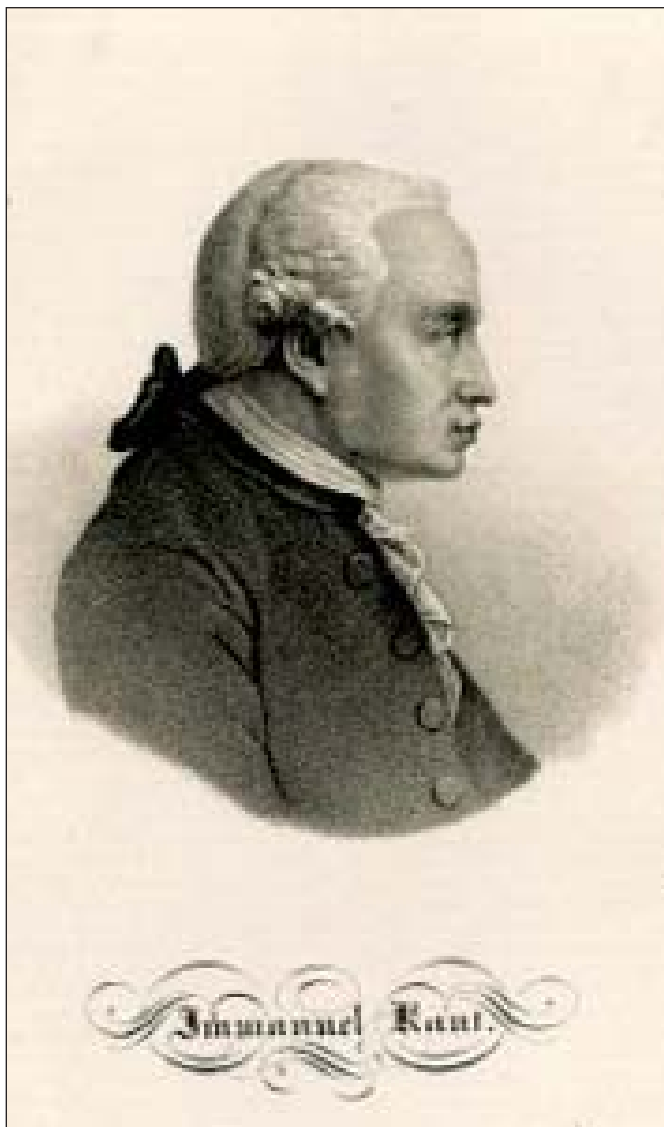
Портрет Іммануїла Канта. Невідомий автор