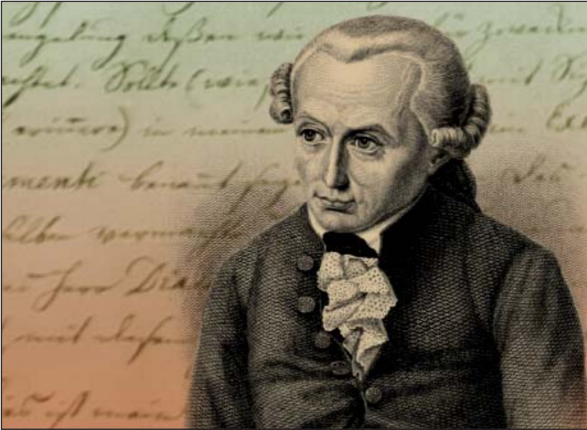
Кант: мій світ і мій вічний мир

У вступі до свого педагогічного твору І. Кант підкреслив, що людина може стати людиною тільки через виховання. Німецький філософ наголошував, що людина є тим, що робить із неї виховання [3, с. 20]. Він, зокрема, акцентував увагу на тому, що виховання є мистецтвом, застосування якого має удосконалюватись протягом життя багатьох поколінь. Адже кожне покоління, озброєне знаннями попередників, все більше буде прагнути до такого виховання, яке пропорційно розвиватиме всі природні здібності людини [3, с. 23]. Кант вважав, що людина повинна розвивати свої здібності, спрямовані на втілення добрих вчинків і справ. Обов'язками людини, застерігав німецький мислитель, є власне розумове удосконалення, самоосвіта, розвиток моральних якостей. Саме тому виховання особистості є однією з найвеличніших проблем. Заслуговує на увагу думка І. Канта, що педагогіка, або наука про виховання, поділяється на фізичну та практичну.