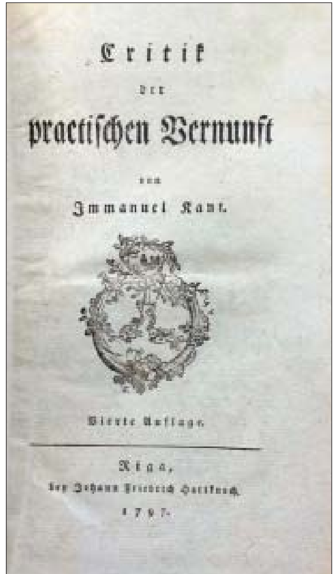
I. Кант. «Критика практичного розуму». 1797 р.

Варто звернути увагу й на те, що у приватному житті I. Кант відрізнявся надзвичайною пунктуальністю і педантизмом. Проте гордовитість і гонор не були визначальними рисами його характеру. Як справжній вчений, він не вважав себе великою людиною. У спілкуванні з друзями I. Кант був комунікабельним співрозмовником, доброзичливим наставником, люб'язним товаришем, приємним і бажаним гостем [3, с. 5].