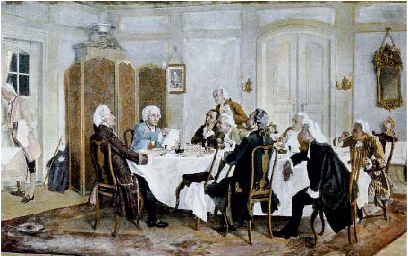
Кант з друзями, зокрема Крістіаном Якобом Краусом, Йоганном Георгом Гаманном, Теодором Готлібом фон Гіппелем і Карлом Готфрідом Гагеном. Ілюстрація: Emil Doerstling / wikipedia.org

ня дітей. У своїй праці «Еміль, або Про виховання» Руссо зробив спробу виокремити основні етапи в розвитку людини від її народження до повноліття, накреслити завдання для кожного з них [2, с. 292]. Перспективні ідеї відомого французького філософа відіграли надзвичайно важливу роль у розвитку поглядів І. Канта на мету, завдання й методи виховання наприкінці XVIII – на початку XIX ст. Слід вказати також, що І. Кант захоплювався педагогічними ідеями та шкільними реформами Й.-Г.-Б. Базедова (1723–1790). Нагадаємо, що Й.-Г.-Б.-Базедов був основоположником філантропізму – прогресивної педагогічної течії в Німеччині (кінець XVIII – початок XIX століть). Він виступав із критикою зубріння, словесного вчення, формалізму, засилля стародавніх мов, жорстокості до дітей, релігійної нетерпимості, які панували в школах [4, с. 5].