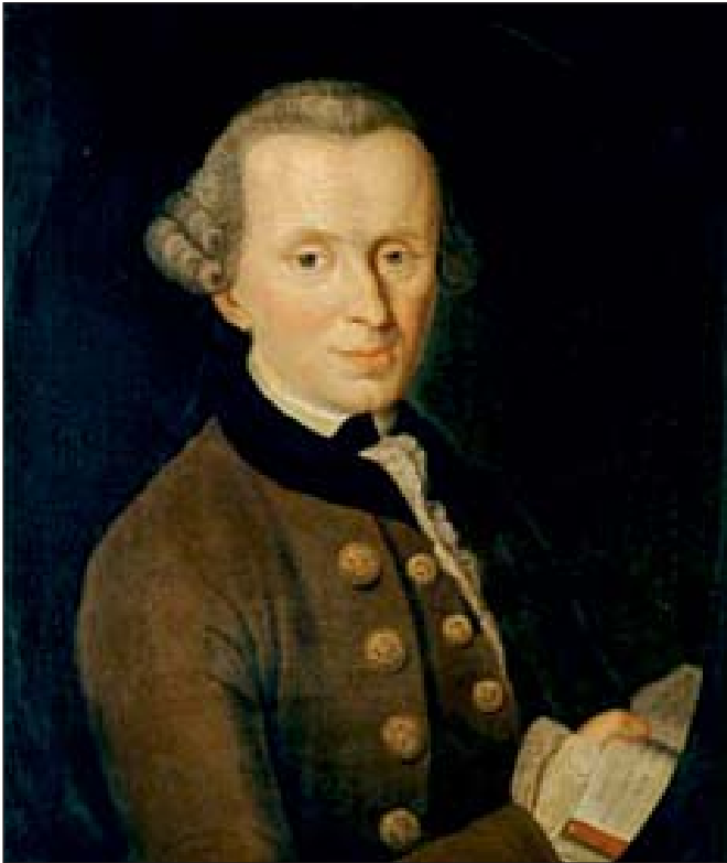
Портрет Іммануїла Канта авторства Йоганна Беккера. 1768 р.

Зазначимо, що в даному випадку методика присвячена навчальному процесу як єдності педагогічної взаємодії викладачів і слухачів, тобто вона передбачає єдність прямих і зворотних зв'язків між ними в конкретних обставинах навчання. Вона має забезпечити інтеграцію всіх необхідних елементів спільної праці тих, хто навчає, і тих, кого навчають. Саму ж педагогіку потрібно теоретизувати, розкриваючи при цьому специфіку виховання і на цій основі затвердити нову педагогічну технологію, яка має реалізувати педагогічні принципи оволодіння мисленням, акцентувати увагу на значенні мотивації до навчання і самоосвіти. В свою чергу філософування потребує педагогіки, яка одночасно дозволяє підняти його якісний рівень і розв'язати при цьому актуальні педагогічні проблеми, які виникли в минулому.