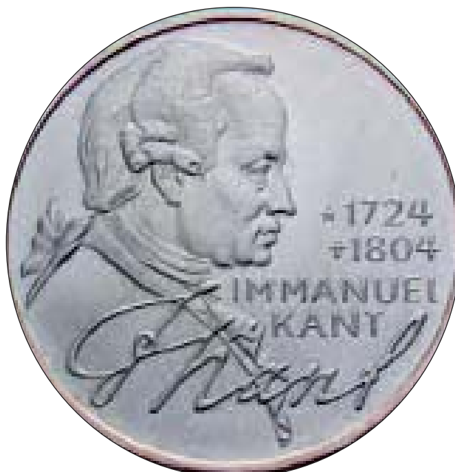
ФРН: випуск 5 марок у 1974 р., присвячених І. Канту. Срібло