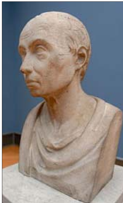
Бюст Канта роботи Емануеля Барду. 1798 р.