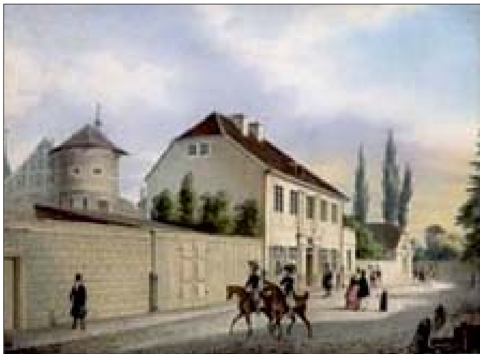
Будинок Канта в Кенігсберзі (тепер Калінінграді) на картині 1842 року