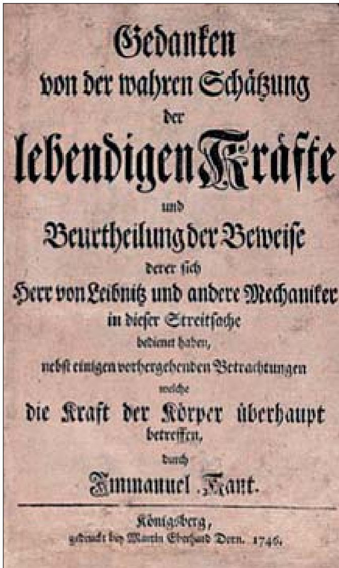
Обкладинка німецького видання першої праці І. Канта