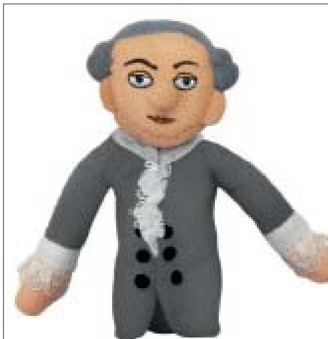
Іммануїл Кант. Пальчикова лялька