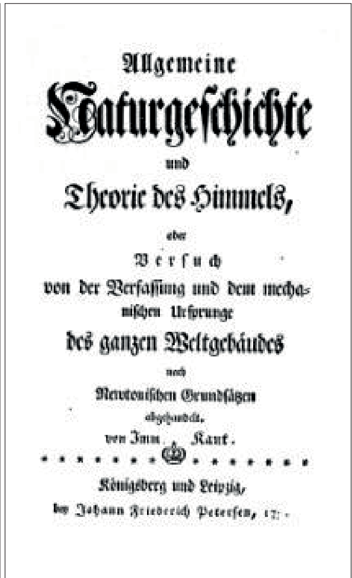
Титульний лист німецького видання «Загальної історії», 1755 р.

Іммануїд Кант у роботах видатних митців, на монетах та в жартівливих ілюстраціях