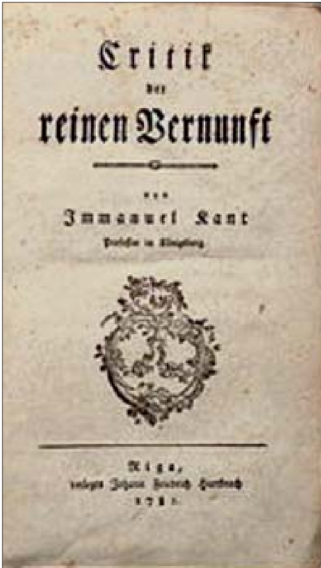
I. Кант. «Критика чистого розуму», 1781 р.

Серед найголовніших праць, в яких німецький мислитель обґрунтував свою філософську систему, до якої гармонійно увійшли і модерні педагогічні ідеї, варто назвати такі: «Критика чистого розуму» (1781); «Критика практичного розуму» (1781); «Критика здатності судження» (1790). Саме ці праці поставили I. Канта на чолі потужного філософського руху історичної епохи Просвітництва.