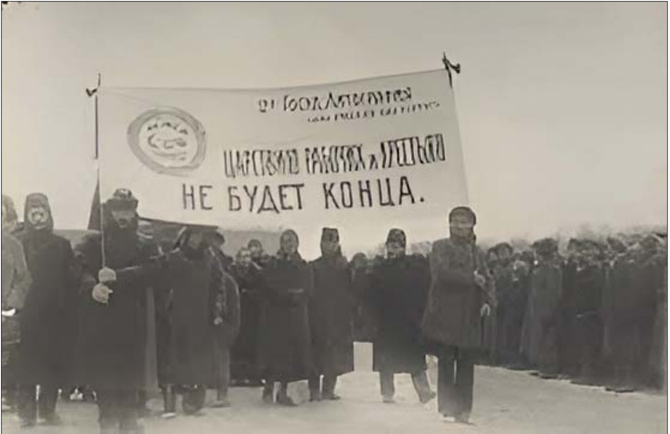
Робітники Другої державної літографії на демонстрації, 1918 рік