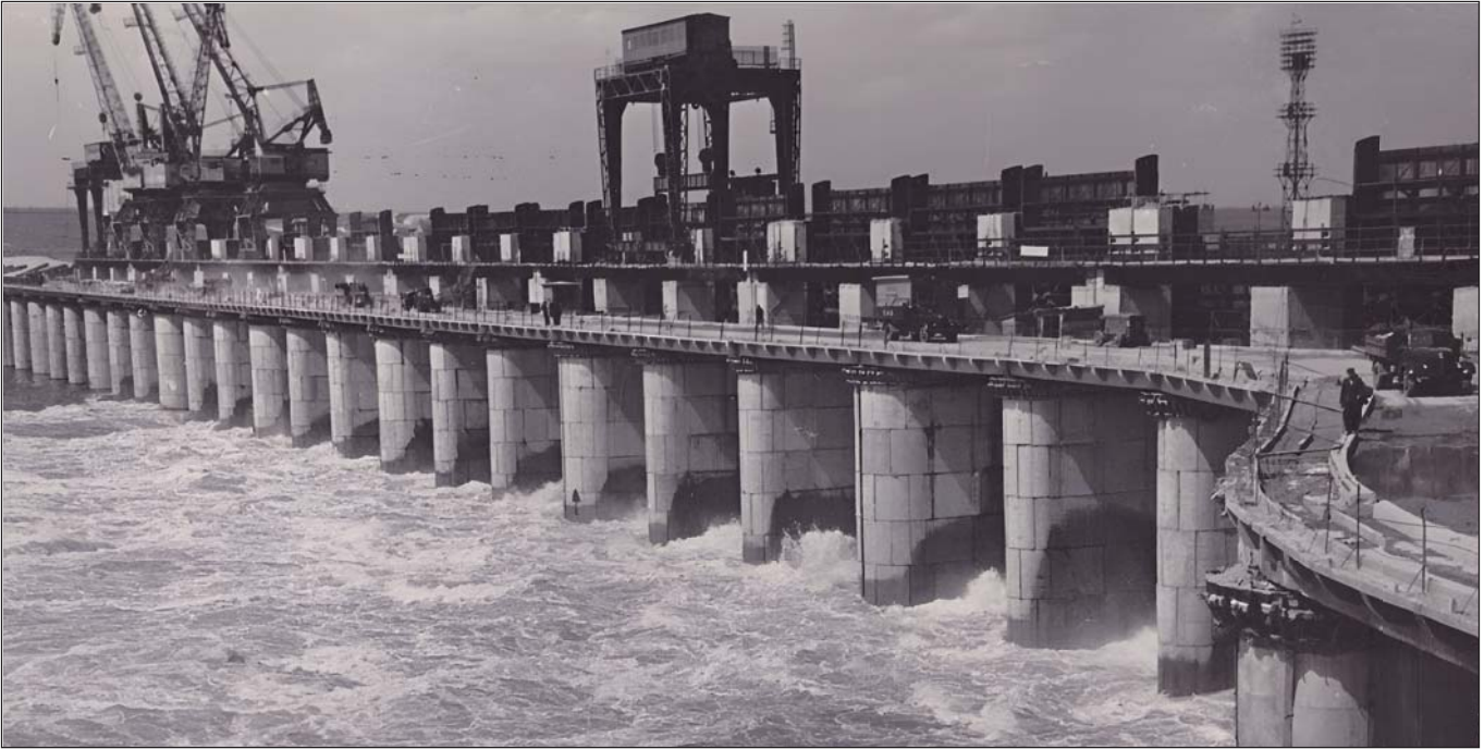
Загальний вид водозливної плотини Каховської ГЕС. Херсонська обл., 1956 р.

Як бачимо, резолюція III з'їзду КП(б)У текстуально повторювала положення декрету ВЦВК «Про соціалістичний землеустрій і про заходи переходу до соціалістичного землеробства» від 14 лютого 1919 р. У свою чергу, вона слугувала основою для постанови по земельному питанню, яку приймав III Всеукраїнський з'їзд рад голосами більшовицьких делегатів. Щоправда, у постанові підкреслювалося: «Селяни на місцях зовсім не розуміють мети комунального обробітку землі» 29 . Це був єдиний зв'язок з реальністю у запропонованій більшовиками постанові.