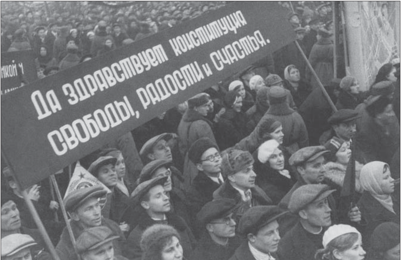
Демонстрація, присвячена ухваленню сталінської Конституції, 1936 рік