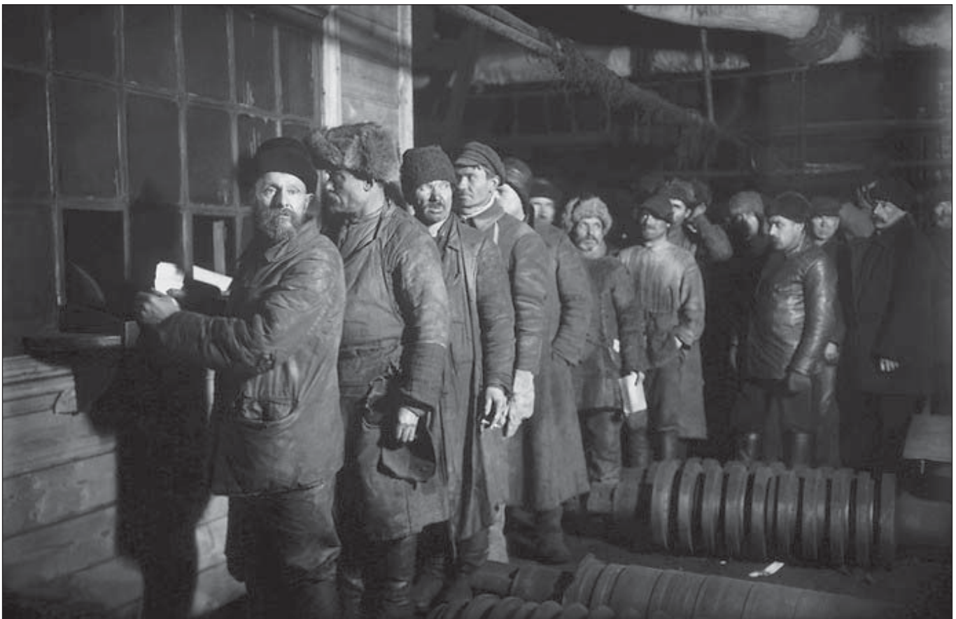
Черга за зарплатою. Завод «Червоний путіловець», 1926 рік