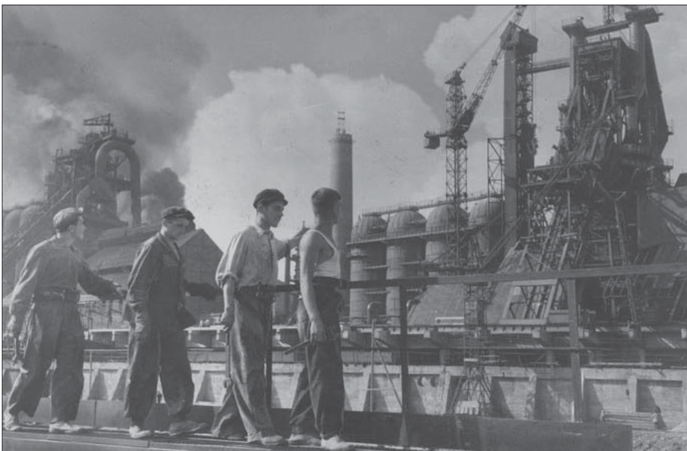
«Криворіжсталь», 1958 рік