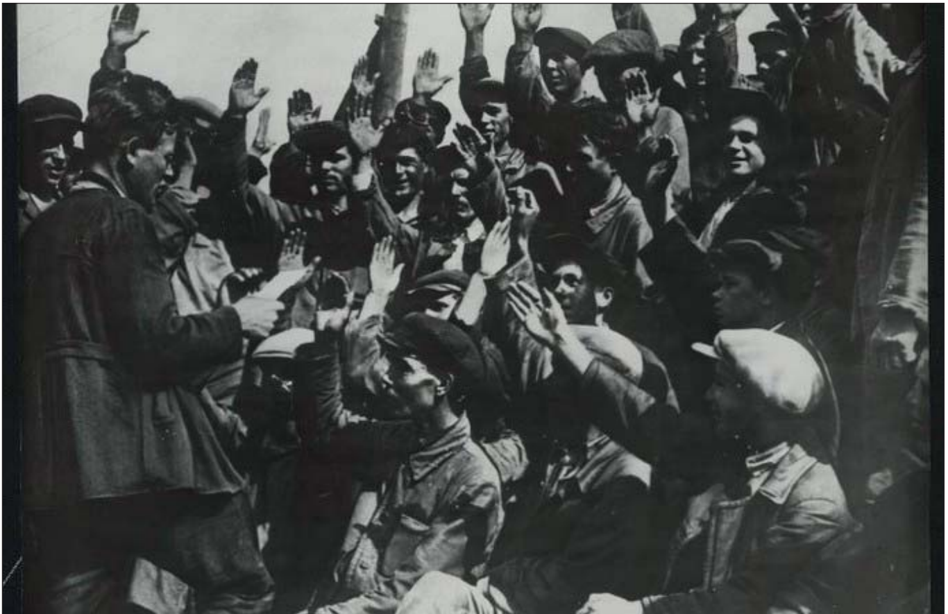
Будівельники Подільського цементного заводу голосують за зустрічний промфінплан. 1930-ті роки