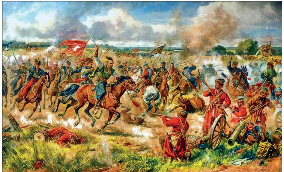
Конотопська битва 1659 року. Картина Артура Орльонова. 2010.