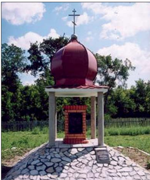
Капличка на полі Конотопської битви

У міжособній боротьбі гетьман Іван Виговський зазнав невдачі, чим негайно скористалися москалі. Під проводом воеводи О. Баратинського вони влаштовують лови на прихильників гетьмана. «Князь Баратинський, вирізавши в Україні більше 15 тисяч українського населення, запитував московського царя дозволити йому «высечь и выжечь» усіх українців на 150 верст навколо Києва». Упродовж кількох наступних років москалі продовжували винищувати майже всіх соратників Богдана Хмельницького.