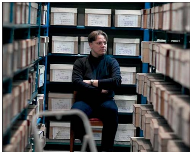
Андрій Когут

Директора Державного галузевого архіву СБУ Андрія Когута початок війни застав у США. Кілька місяців він присвятив вивченню в архіві Інституту Гувера при Стенфордському університеті документів про операцію «Захід» – примусову масову депортацію жителів заходу України до віддалених районів СРСР у 1947 році.