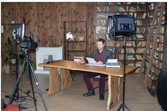
Владлен Мараєв

Але наприкінці березня «Історія без міфів» повернулася: замість відео звичайного для каналу формату на ньому стали з'являтися стрими з лекціями Мараєва – на це йде набагато менше часу і сил.