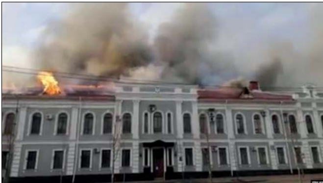
Палаюча будівля СБУ у Чернігові 25 лютого 2022 року

На сьогодні відомо про постраждалих від російських обстрілів будівлі обласних державних архівів у Харкові, Миколаєві та Лисичанську (архів Луганської області). Документи вцілили. А ось архів управління СБУ у Чернігівській області, як повідомила українська омбудсменка Людмила Денісова , вберегти не вдалося: будівля згоріла після влучення снарядів.