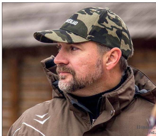
Максим Остапенко