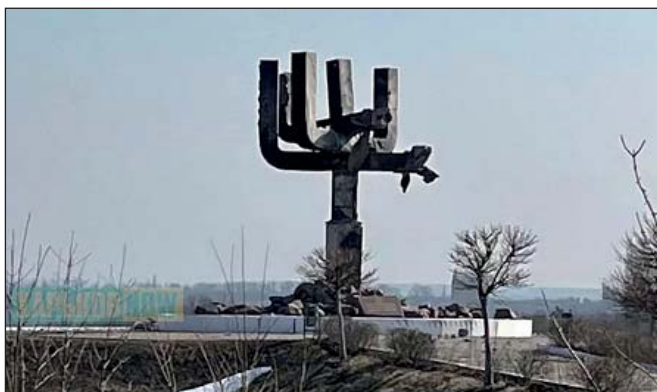
Пам'ятний знак «Древо життя» (менора), пошкоджений під прицільними обстрілами Дробицького Яру (поблизу Харкова) 26 березня 2022 р.

Система історичних поглядів «колективного Путіна» відразу дала про себе знати на окупованих Росією територіях. Крім вилучення книг, це – підняті червоні прапори, повернення радянських назв захопленим містам та руйнація пам'ятних знаків.