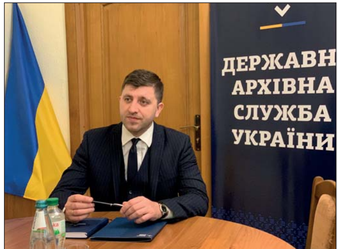
Анатолій Хромов

На своїй сторінці у Facebook голова Державної архівної служби України Анатолій Хромов написав: «Я потім розповів вам кілька реальних історій про сміливість наших колег при порятунку документів. Сльози радості діловодів, яким ми допомогли евакуювати документи НАФ (Національного архівного фонду) з-під обстрілів у відносно безпечні місця. Я вражений чуйністю керівників окремих регіонів, які серед хаосу війни пішли на контакт та миттєво організували порятунок наших культурних архівних цінностей». Він також розповів, що там, де це можливо, архіви вже розпочали створення фондів, присвячених відображенню російської агресії у 2022 році.