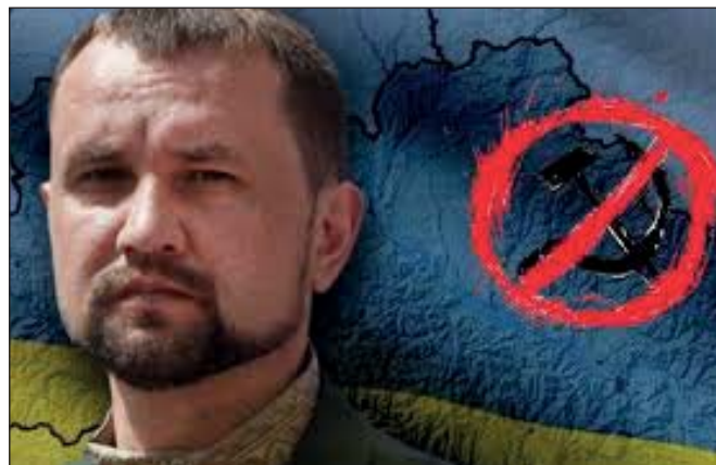
Володимир В'ятрович