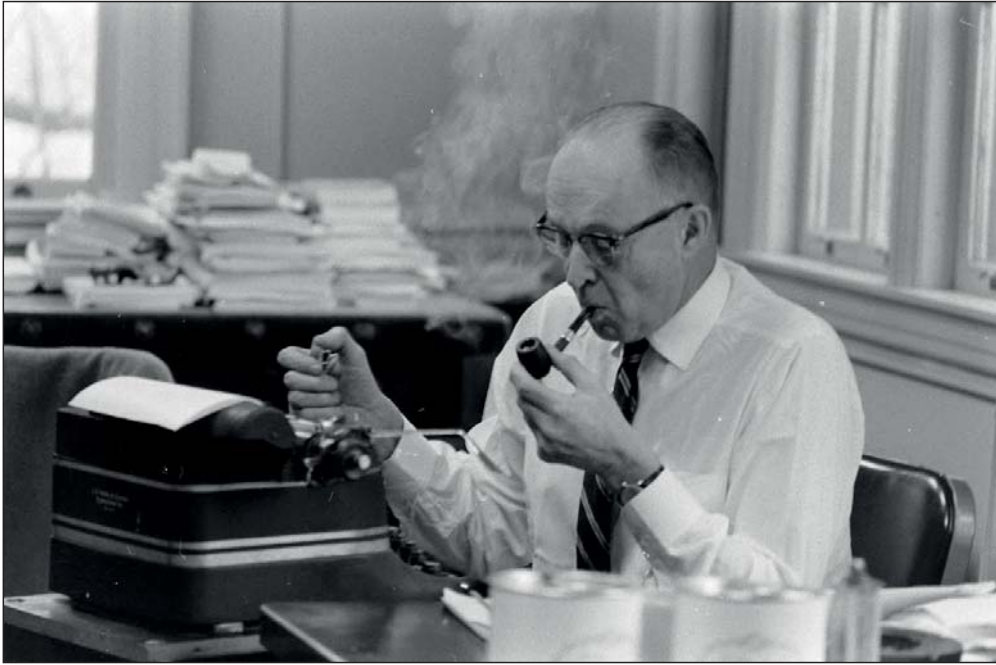
Д-р Джордж Кістяківський у своєму офісі

Однак майже півстоліття Україна не знала про існування цього щоденника – то й не дивно, адже за радянських часів прізвище автора (не лише відомого фізичного хіміка та лауреата багатьох престижних наукових відзнак, а й активного учасника проекту «Мангеттен» зі створення атомної бомби) практично не згадували. Та що казати – не знали й після проголошення незалежності. Проте кілька років тому книжка таки потрапила до України.