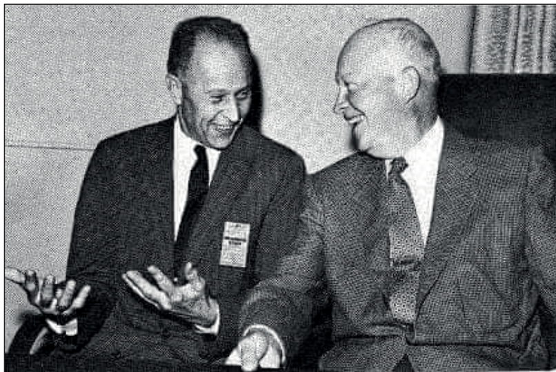
Президент США Дуайт Ейзенхауер зі своїм радником д-ром Джорджем Кістяківським