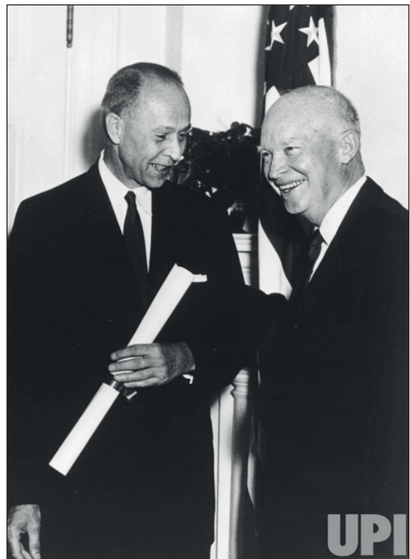
Президент США Д. Ейзенхауер і Дж. Кістяківський. 1958 р.

зрозуміти процес прийняття рішень на найвищому рівні. Д-р Дж. Кістяківський хоч порівняно й недовго пропрацював у Білому домі, проте був причетний до багатьох важливих проектів Пентагону та Федеральної ради з науки і техніки. У своїх записах він постає перед нами людиною демократичною, надзвичайно працювитою, енергійною, масштабною, вимогливою, активною.