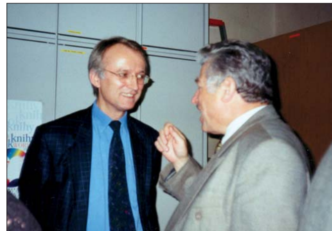
Учасники відкриття курсу – професор Віденського університету І. Гук та Надзвичайний та Повноважний Посол України в Республіці Австрія М. Макаревич (праворуч)