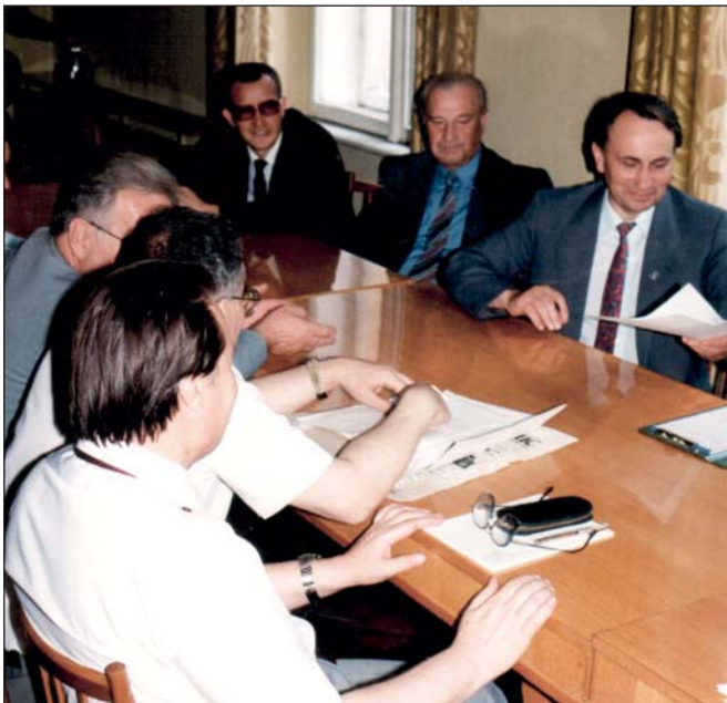
Під час підписання Угоди про відкриття Львівської філії Австрійського інституту Східної і Південно-Східної Європи (3.10.1992 р).