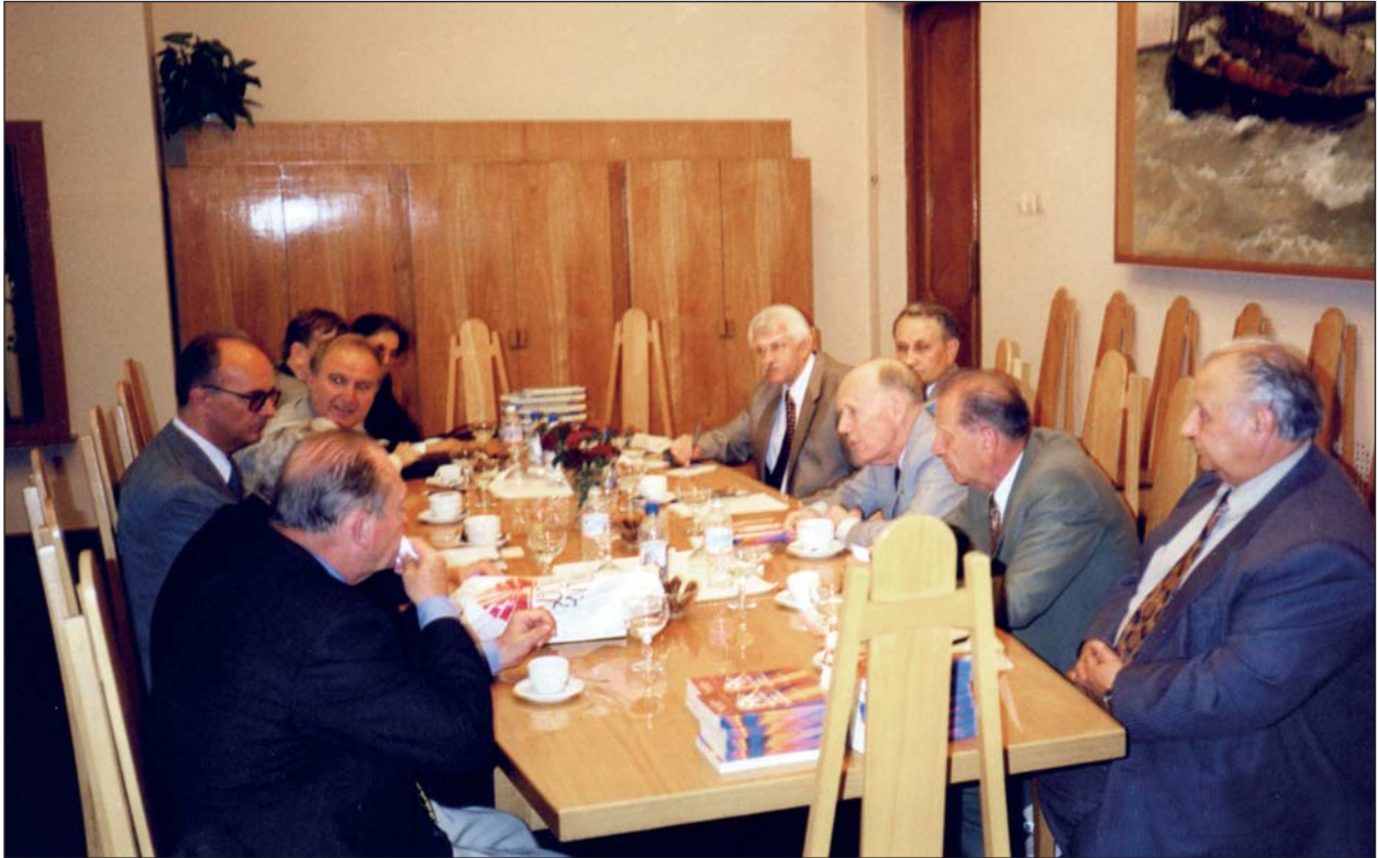
Зустріч членів Президії НАН України з гостем КНК віцепрезидентом австрійського Creditanstalt-банку д-ром В. Фремутом. Київ, 7 червня 1999 р. Правий ряд – академіки НАН України А. Шидловський та Б. Стогній, Президент НАН України академік НАН України Б. Патон, академік НАН України Я. Яцків. Лівий ряд – д-р В. Фремут (другий), Посол Австрійської Республіки в Україні д-р К. Фаб'ян (третій)

25 – 28 жовтня 1999 р. у Києві перебував іноземний член Комітету професор Віденського університету І. Гук. Проф. І. Гук брав участь у нараді з питань використання плазмотрону і зварювання в медичній практиці.