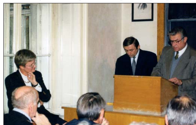
Відкриття курсу «Українська мова і література» у Віденському університеті. Виступає Надзвичайний та Повноважний Посол України в Республіці Австрія М. Макаревич. Біля вікна – професор Інституту славістики Віденського університету Ю. Бестерс-Ділгер