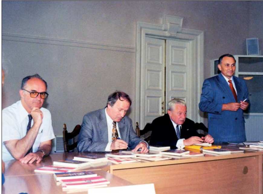
Засідання «Елітарної світлиці» за участі Посла Республіки Австрія в Україні д-ра К. Фаб'яна (перший зліва) та віце-президента австрійського Creditanstalt-банку д-ра В. Фремута (другий справа). Київ, 2 червня 1999 р.

20 січня 1999 р. проф. І. Гук був гостем КНК при обговоренні результатів викладання курсу «Українська мова і література» у Віденському університеті. Цей курс було започатковано в 1997 році за активної співпраці КНК, Інституту українознавства Київського національного університету імені Тараса Шевченка та Інституту славістики Віденського університету.