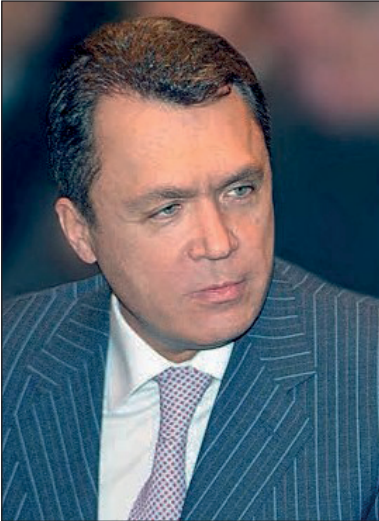
Володимир Семиноженко доктор фіз.-мат наук, академік НАН України, Генеральний директор ДНУ «НТК Інститут монокристалів НАН України», голова Північно-Східного наукового центру НАН України, член Президії НАН України