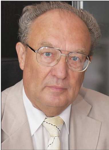
Володимир Гончарук доктор хім. наук, академік НАН України, радник Президії НАН України, директор Інституту колоїдної хімії і хімії води ім. А.В. Думанського НАН України

«Я бачу своє завдання в тому, щоб не змушувати вас щось робити, а змушувати думати і приймати спільні й правильні рішення»