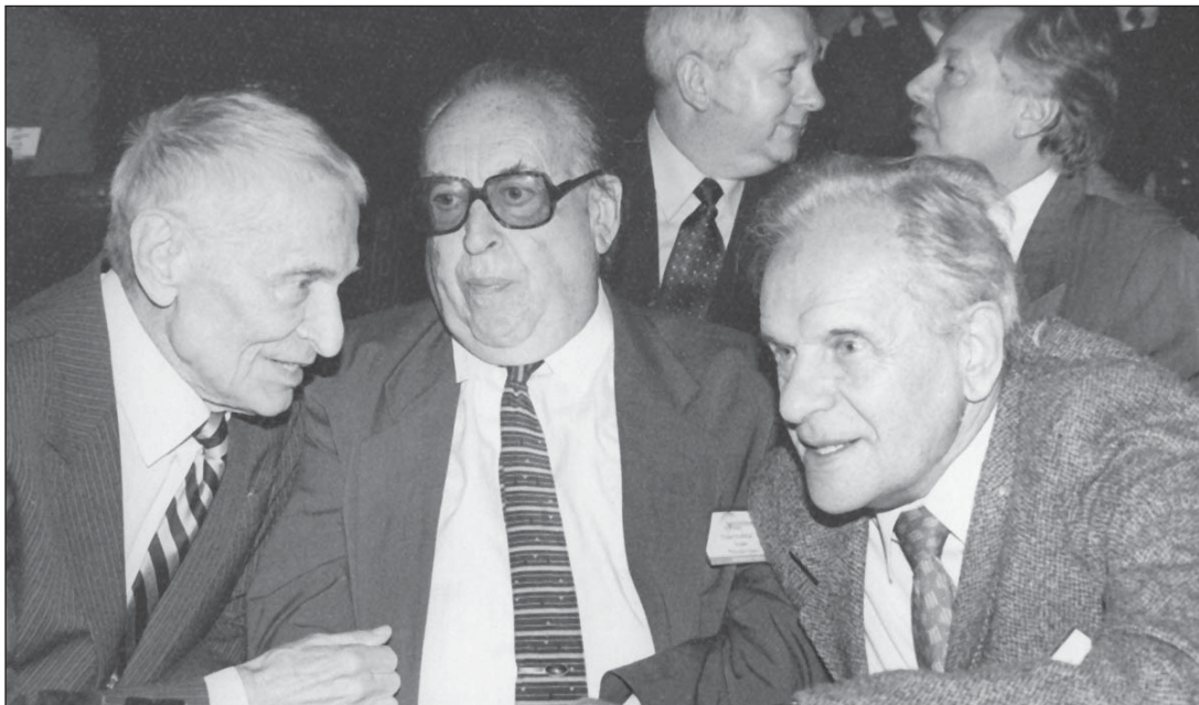
Академіки Микола Амосов, Ісаак Трахтенберг і Платон Костюк

До послідовників Миколи Михайловича належать і представники створеної ним наукової школи біологічної кібернетики. За його ініціативи в Україні виходить журнал «Серце и судини», ювілей якого не так давно відзначила медична громадськість. На ювілейних урочистостях прозвучали слова подяки на адресу лікарської династії Амосових. Сьогодні журнал, очолюваний членом-кореспондентом Національної академії медичних наук України Катериною Миколаївною Амосовою і професором Володимиром Дем'яновичем Мішаловим , – це один з найцікавіших і ґрунтовних вітчизняних кардіологічних журналів. Все, про що згадувалося вище, – і інститут на пагорбі старої київській вулиці, названий ім'ям Амосова, і соратники Миколи Михайловича – кардіохірурги, біокібернетики, і згадане видання – реальне втілення в життя шанування і пам'яті нашого видатного сучасника.