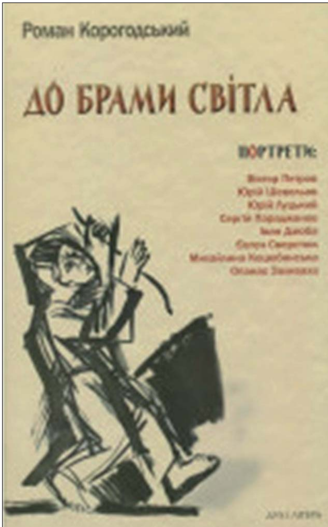
Обкладинка книги Романа Корогодського «До брами світла»

Згадую, як важко було йому вистоювати на холоді під стінами Верховної Ради й Верховного суду, очікуючи доленосних рішень. І як по-дитячому тішився подарованим мною помаранчевим Миколайчиком, що мав принести перемогу.