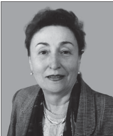
Надія Гула докторка біол. наук, професорка, член-кореспондентка НАН України та НАМН України, гол. наук. співроб. відділу біохімії ліпідів Інституту біохімії ім. О.В. Палладіна НАН України, м. Київ