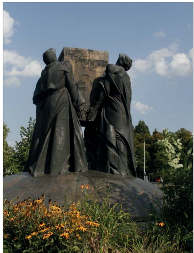
Євген Прокопов. Пам'ятник студентам та викладачам Київського державного університету імені Тараса Шевченка. 1989. Бронза. В. 6 м. Київ