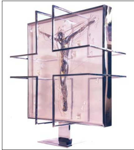
Кришталевий простір. 1995. Скло, бронза, позолота. В. 65 см. Музейний центр біблійного мистецтва у Далласі, Техас, США