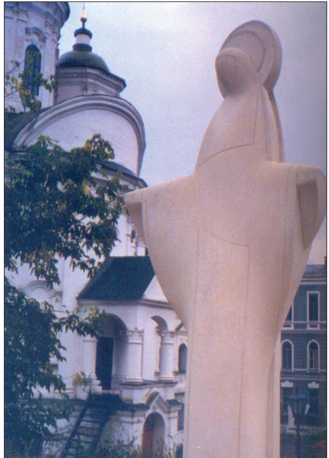
Євген Прокопов. Покрова. 1992. Вапняк. В. 2,5 м. Київ