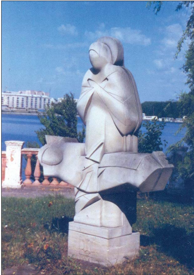
Євген Прокопов. П'єта. 1990. Вапняк. В. 2,5 м. Тернопіль