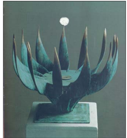
Тайна вечере. 1992. Бронза, патина. В. 33 см. Церква Naialse в Одесі, Данія

пам'ятник студентам і викладачам Київського державного університету у вигляді чотирьох фігур, що з великим зусиллям тримають величезний куб. Він символізує значення науки у пізнанні Всесвіту. Його встановлено у 1989 році біля корпусу фізичного факультету напроти колишньої ВДНГ. Євген і досі переконаний, що це один із найкращих його монументальних творів.