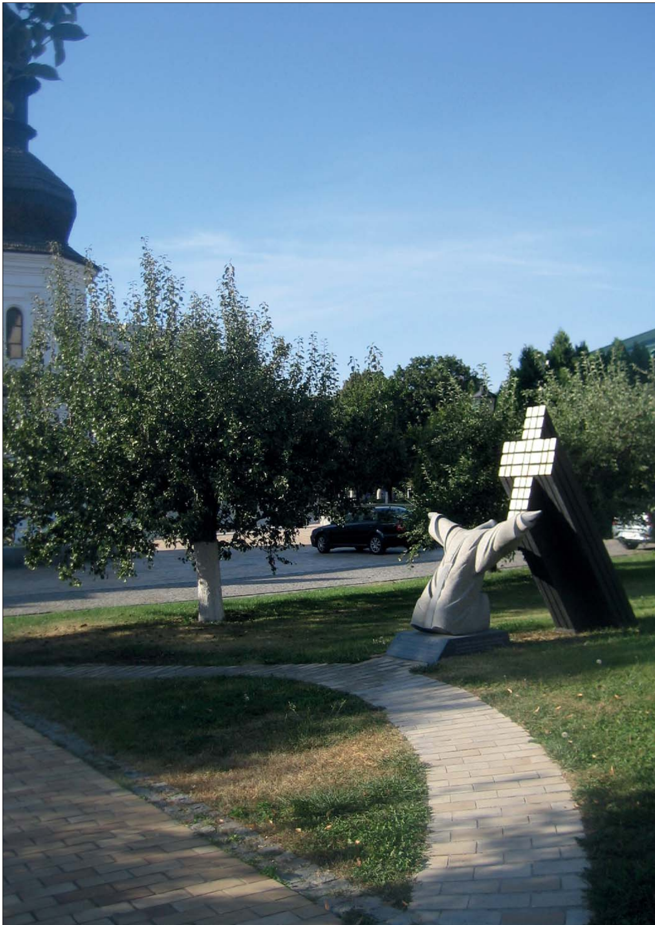
Євген Прокопов. Жертвам за віру. Архітектор Нестор Попович. 1988 (відновлено у 2019). Граніт, бронза. В. 2,5 м. Київ. Фото Людмили Лисенко