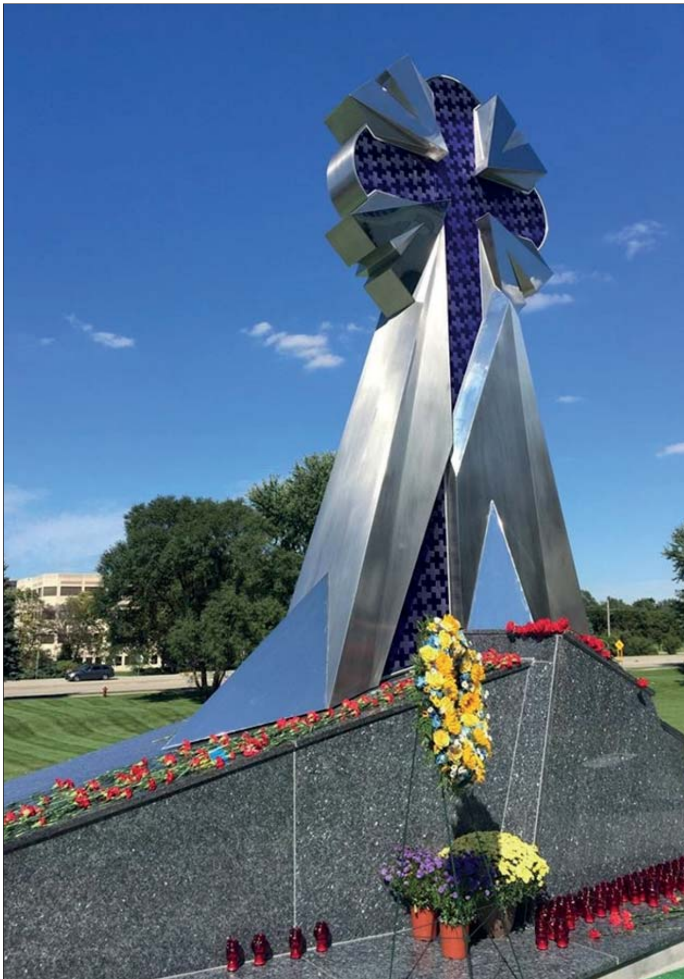
Євген Прокопов. Пам'ятник Небесній сотні. Архітектор Орест Бараник. 2015. Нержавіюча сталь, скло, граніт. В. 8 м. Українська церква св. Андрія. Блумінгдал, штат Іллінойс, США