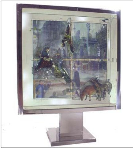
Різдво. 2007. Бронза, патина, скло, призми. В. 78 см. Національний художній музей України, Київ