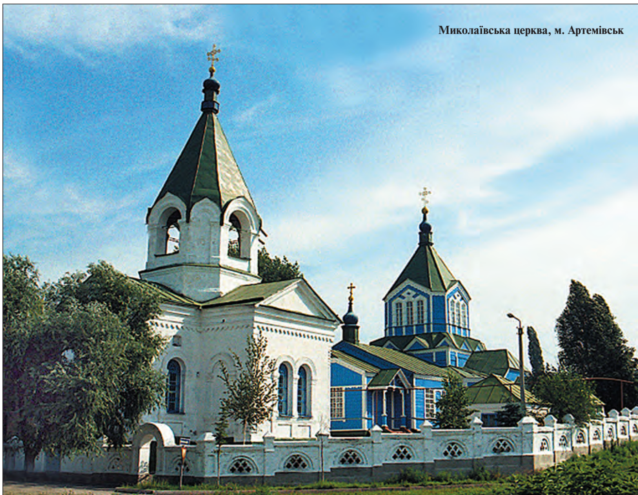
Миколаївська церква, м. Артемівськ

На фоні багатьох регіонів України, Донщина не може похвалитися великою кількістю архітектурних або культурних пам'яток та їхнім поважним віком. Найвидатнішою культурною спорудою Донецького краю є надзвичайно ефектні, розташовані на крейдяних скелях над Сіверським Донцем, будівлі Святогірського Успенського монастиря (перші згадки датуються 1624 р.), нещодавно освяченого як третя в Україні (після Києво-Печерської та Почаївської) православна лавра. На Донщині збереглося кілька храмів кінця XVIII — початку XIX ст., адміністративні та громадські споруди часів Російської імперії та багато пам'яток радянської епохи, серед яких видатні меморіальні комплекси часів Другої світової війни ("Міус-фронт", "Саур-Могіла" тощо), десятки різноманітних музеїв і монументів.