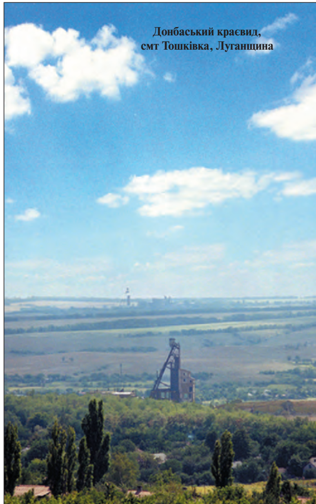
Донбаський красвид, сmt Тошківка, Луганщина

На Донщині в 1997 р. створено, напевно, один із наймальовничіших національних природних парків рівнинної України — "Святі Гори". Своєрідний ландшафтний комплекс парку (заг. площа — 405,89 км 2 ) включно крейдяні останці, балки та яри корінного правого берега головної водної артерії Донщини — Сіверського Донця та її майже трикілометрову заплаву й борову терасу на протилежному березі річки. ■