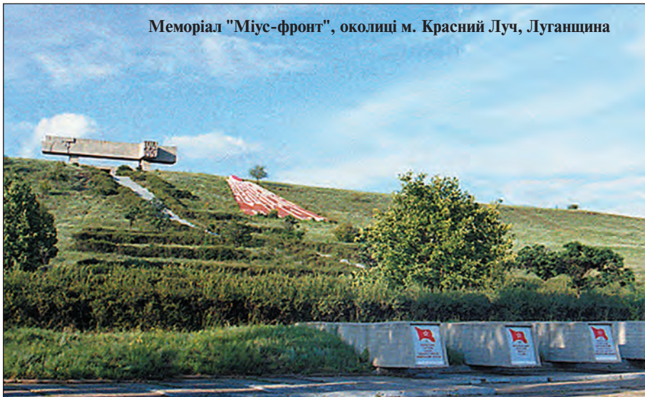
Меморіал "Міус-фронт", околиці м. Красний Луч, Луганщина

Перші поселення на теренах Донщини (в східній частині Приазовської височини) відомі з раннього палеоліту, а численні залишки помешкань пізнього палеоліту, розкопаних археологами, досить щільно вкривають береги долин Сіверського Донця і його приток. Наприкінці IX ст. на ці землі прийшли кочові племена скотарів печенігів, на початку XI ст. — торків, а в середині XI ст. — половців, від перебування яких у безкраїх степах залишилися десятки тисяч кам'яних ідолів. У 1220—41 рр. зі сходу відбулося масове й руйнівне монгольське вторгнення, що охопило значні території до Польської й Балканських держав включно. Воно на століття зумовило знелюднення й занепад у розвитку Донецького краю, залучивши його в межі так