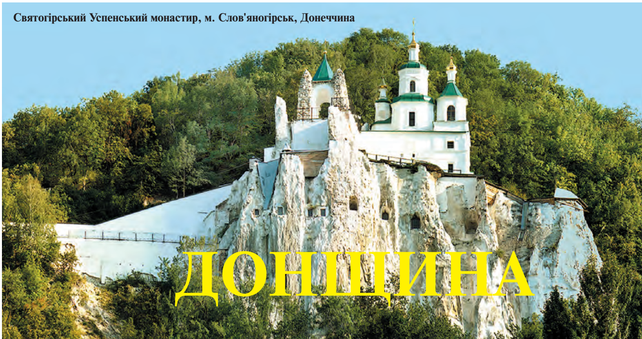
Святогірський Успенський монастир, м. Слов'яногірськ, Донеччина