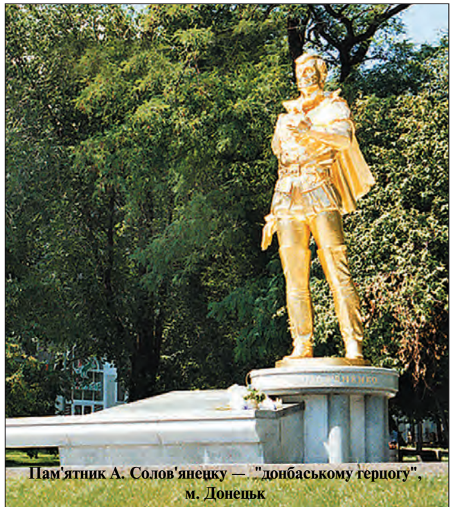
Пам'ятник А. Солов'янецку — "донбаському герцогу", м. Донецьк

перетворюється в центр гірничодобувної, металургійної, машинобудівної та інших промисловостей на півдні Російської імперії. За радянських часів на Донщині, що продовжувала інтенсивно економічно розвиватися, видокремлено Донецьку область, яку 1938 р. поділено на дві — Сталінську та Ворошилоградську, що існують донині, але з іншими назвами.