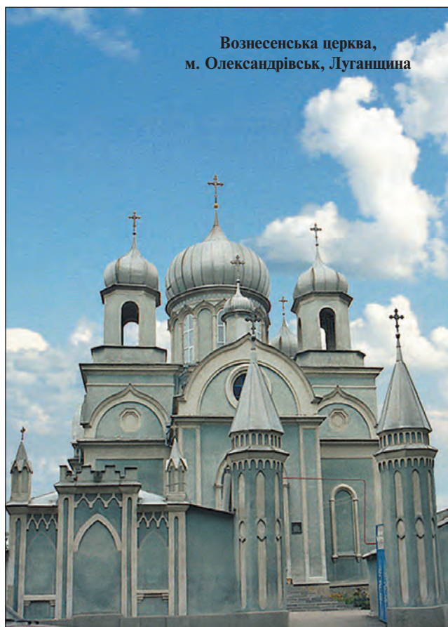
Вознесенська церква, м. Олександрівськ, Луганщина

На території Донщини створено два природних заповідники, філії (або ділянки) яких розкидано по різних районах Донецької та Луганської областей. Найстарішою заповідною ділянкою ще з 1931 р. був "Стрільцівський степ" (Міловський р-н) — невеликий шматок (нинішня площа 5,22 км 2 ) колись