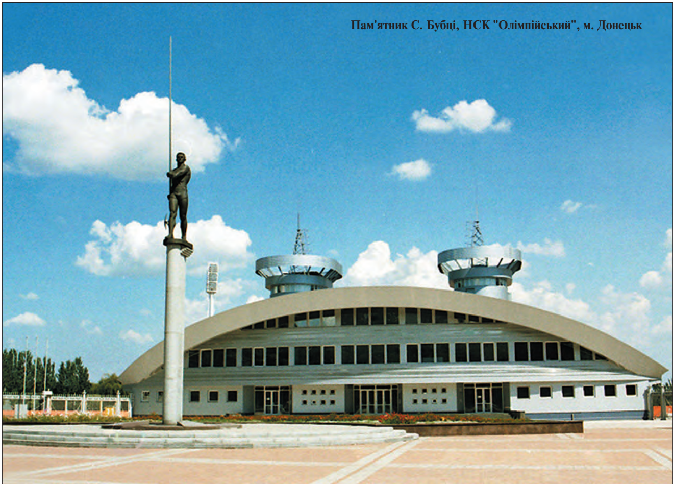
Пам'ятник С. Бубці, НСК "Олімпійський", м. Донецьк

званого Дикого поля, контрольованого Золотою Ордою. Зі середини XV ст. значна частина донських земель (передусім приазовських) входила до Кримського ханства, яке згодом підпало під владу Османської імперії. Довгий час ці землі слугували місцем єдиного притулку для поодиноких селянських родин, які тікали від злиднів на Донщину з півночі та заходу. Активне заселення краю почалося у період визвольної війни українського народу (1648—1654 рр.), від жахів якої бігли селяни з Правобережної України. XVIII ст. пройшло в численних війнах, що вела Російська імперія з Туреччиною за розширення своїх просторів і за вихід до південних морів. Вони сприяли поступовому витісненню мусульманської держави з Північного Причорномор'я та Приазов'я, а згодом і Криму, та досить активному заселенню Донщини слов'янами (селянами з Росії, Правобережної України та Слобожанщини і, навіть, вихідцями з Балкан — сербами) та християнським населенням Криму (греками, грузинами, валахами та вірменами).