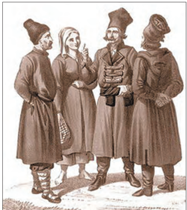
Русини середини XIX ст.