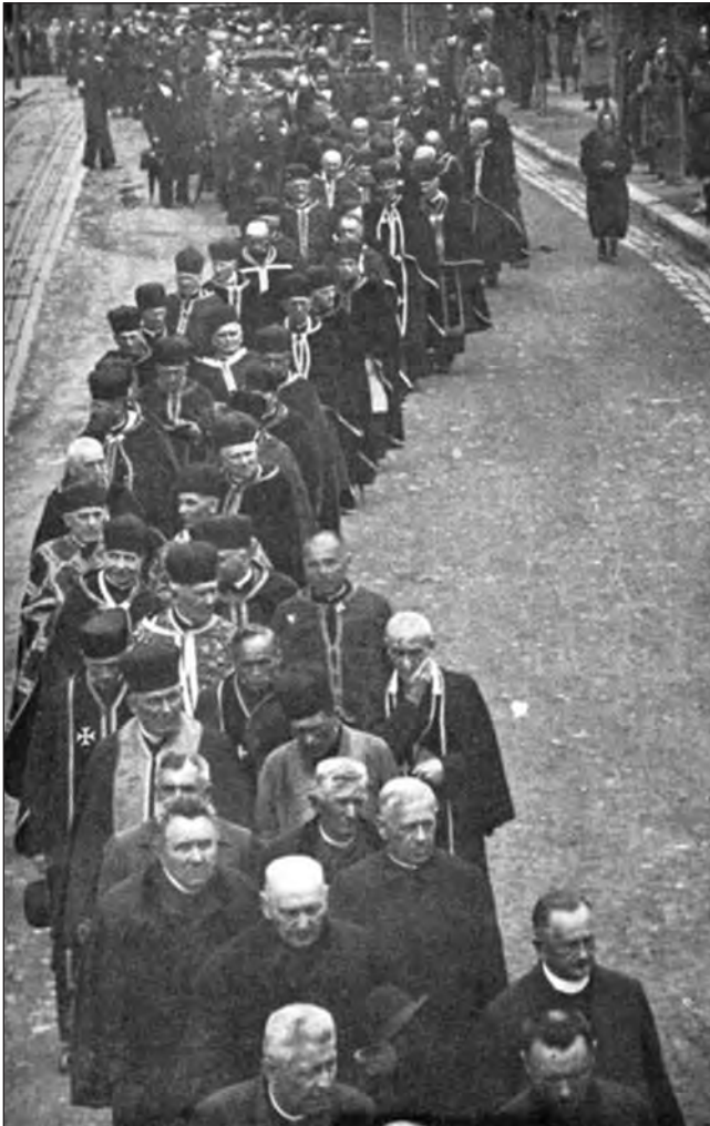
"Талергофський" з'їзд, на який прибули близько 15 тис. учасників з нагоди відкриття пам'ятника на Личаківському кладовищі у Львові. 1934 р.

У 1916 р. східну частину Галичини знову окуповано російським військом у результаті "Брусилівського прориву", та під тиском німецького війська довелося все-таки відступити. Для уникнення мобілізації населення до "ворожої армії" знову застосували давні прийоми — заручники та вивезення до російської глибинки.