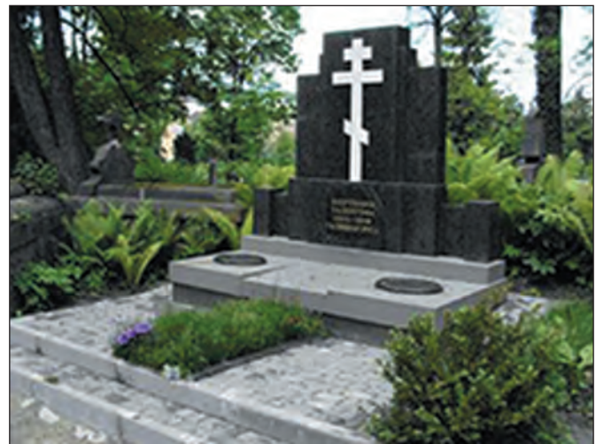
Пам'ятник жертвам Талергофу на Личаківському кладовищі у Львові