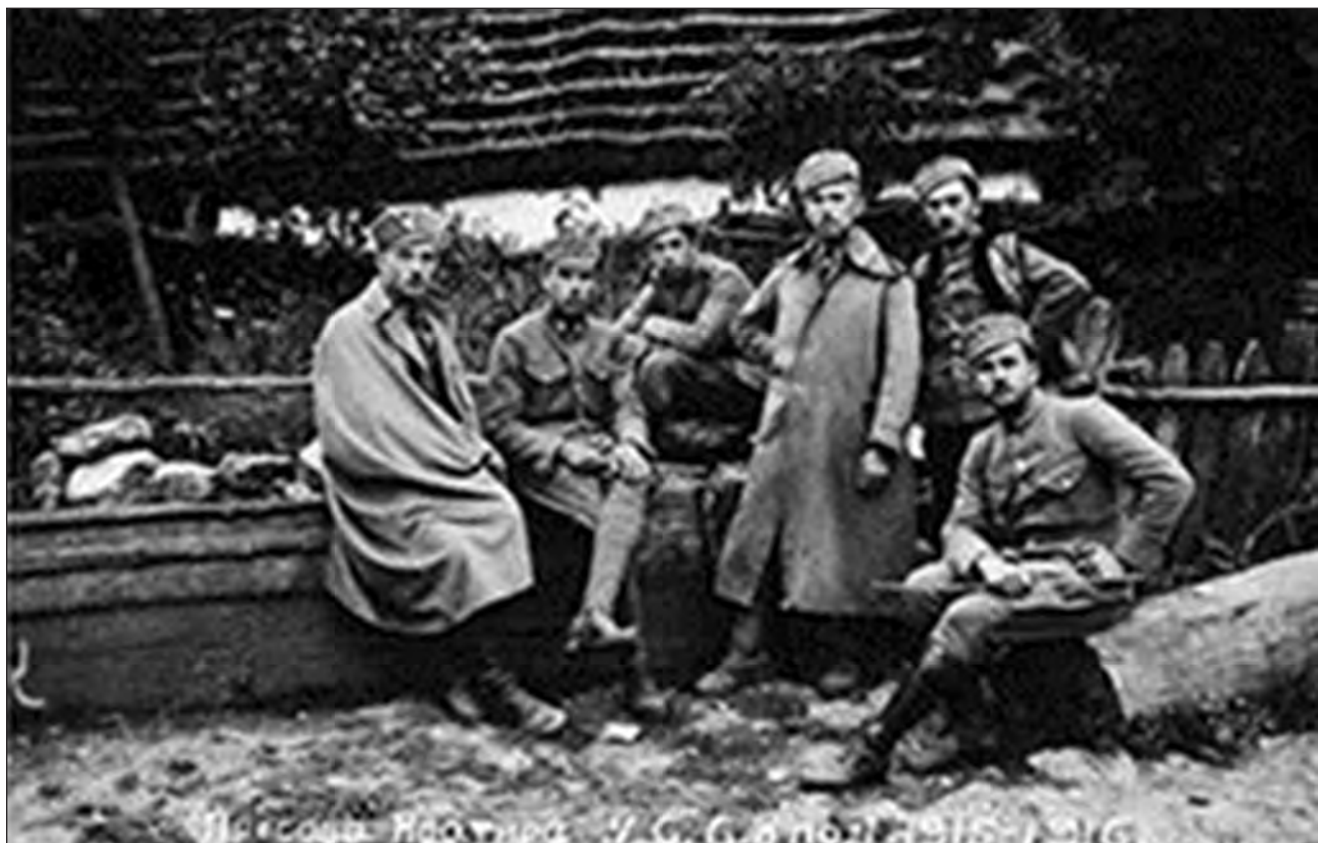
Січові стрільці на відпочинку