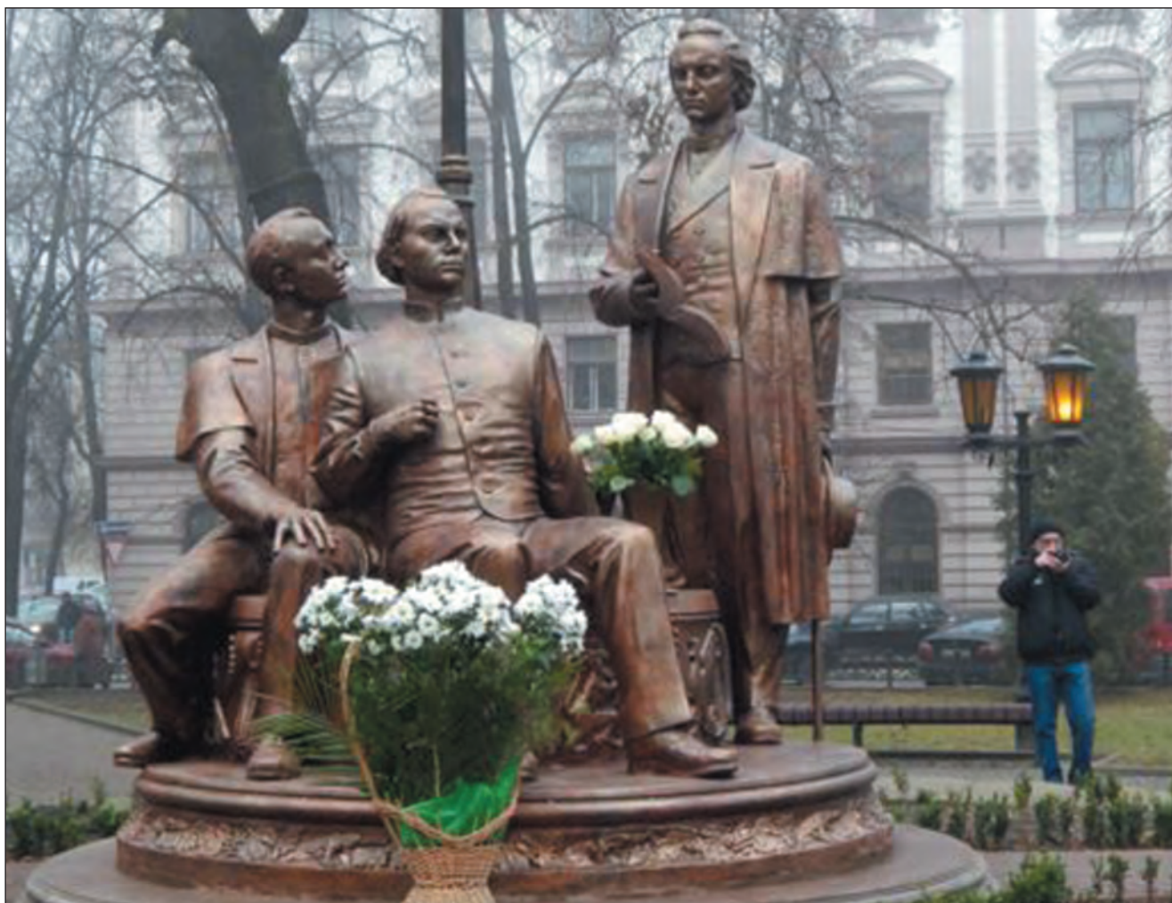
Пам'ятник "Руській трійці" — М. Шашкевичу, І. Вагилевичу та Я. Головацькому — у м. Івано-Франківську. Скульптор — Володимир Довбенюк. Пам'ятник відкрито 31 грудня 2013 р.

Створене в 1830-х роках Маркіяном Шашкевичем , Іваном Вагилевичем та Яковом Головацьким літературне об'єднання "Руська трійця" заявило, що русини Галичини, Буковини й Закарпаття є частиною єдиного українського народу. Істотною заслугою "Руської трійці" було видання альманаху "Русалка Дністровая" (1837 р.), що, замість язичія, користувався живою народною мовою, розпочавши цим у Галичині нову українську літературу. В Перемишлі засновано просвітницьке "Товариство священиків", а митрополит М. Левицький розпочав заходи щодо впровадження рідної мови в початкових школах, розробці перших граматики [12]. На жаль, доброго наміру цих осередків національного відродження не зрозуміла тодішня верхівка греко-католицької церкви, що стояла на засадах зашкарублого русинства, за що згодом дорого прийшлося заплатити її пастві в таборах Талергофу [13].