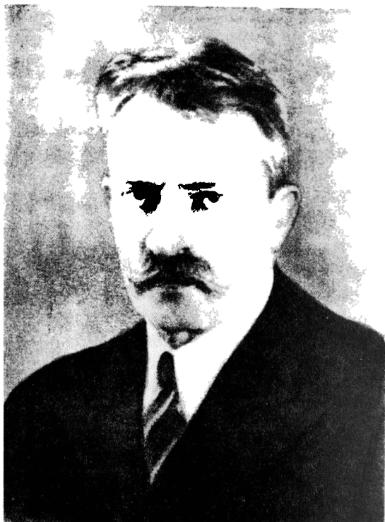
А.Я. Орлов (портрет)

Александр Яковлевич Орлов (1880–1954) — астроном и геофизик, чл.-корр. АН СССР (1927 г.), акад. АН УССР (1939 г.). Родился в г. Смоленске. В 1902 г. окончил Петербургский универ-