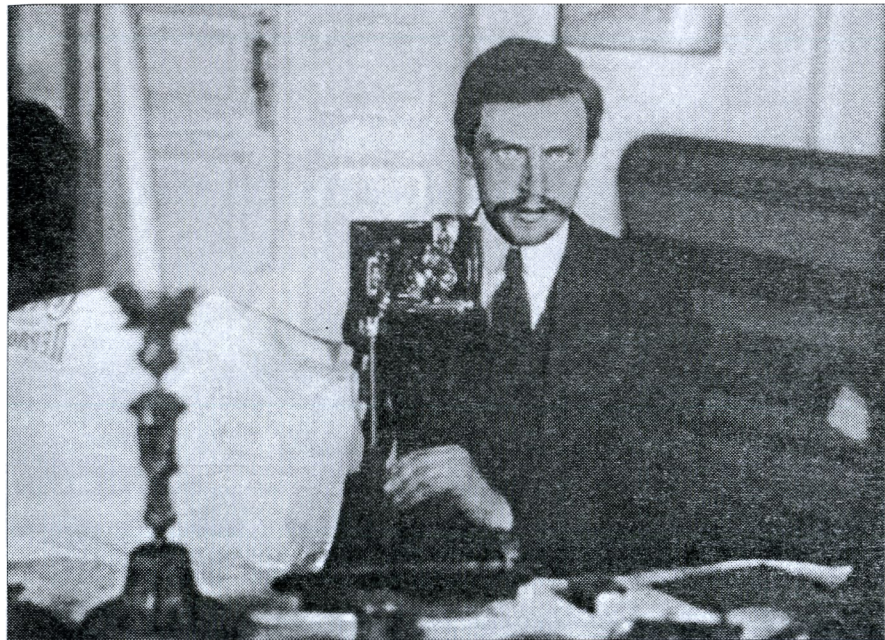
О. Я. Орлов — автофото з дзеркалом

Про це свідчить його багата наукова спадщина та заснована ним наукова школа глобальної геодинаміки і астрометрії [5, 6]. В історію досліджень руху полюсів Землі увійшли поняття, що носять його ім'я: «метод Орлова для обчислення середніх широт», «координати полюса у системі Орлова».