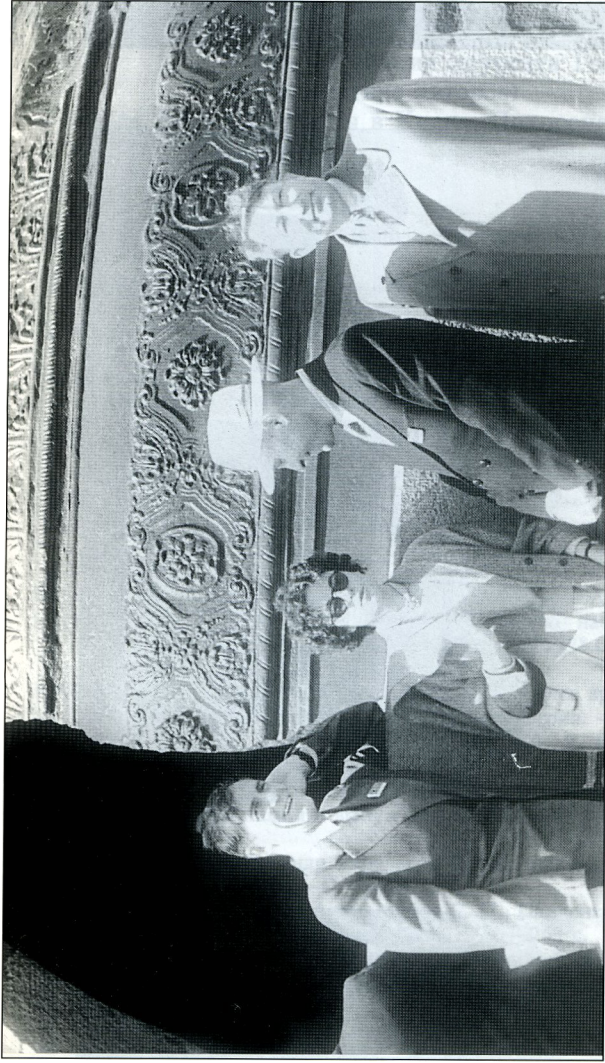
Во время экскурсии в Кремле (Москва, IX съезд МАС, 1958 г.)