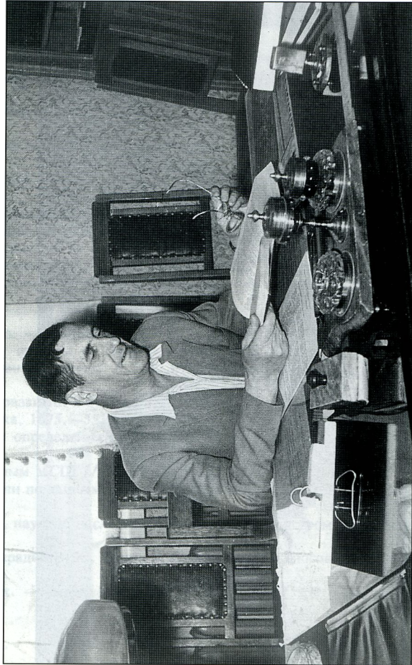
Е. П. Федоров - директор ГАО АН УССР (фото 1960 г.)