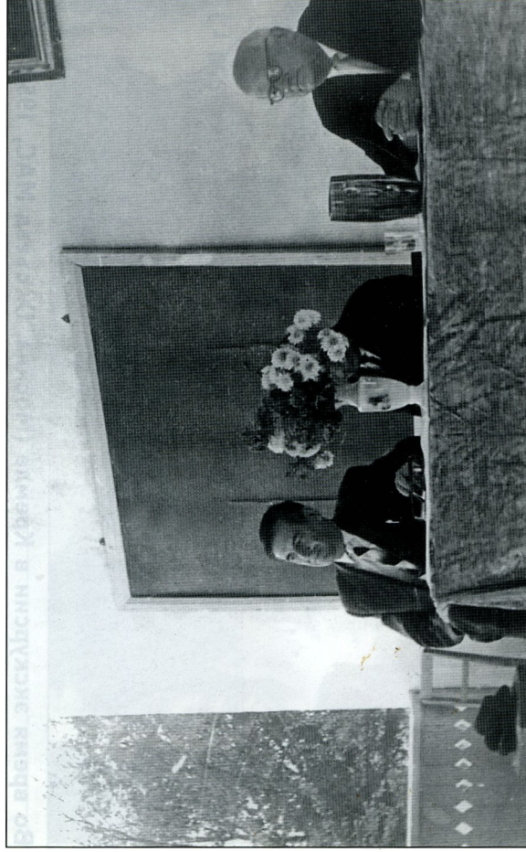
Китайская широтная конференция (1964 г.)