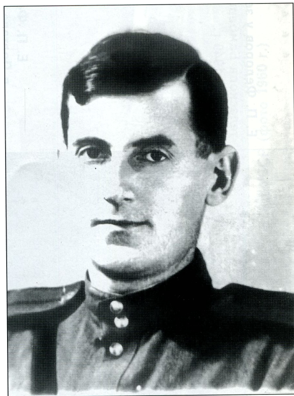
Служба в действующей армии (1942 г.)